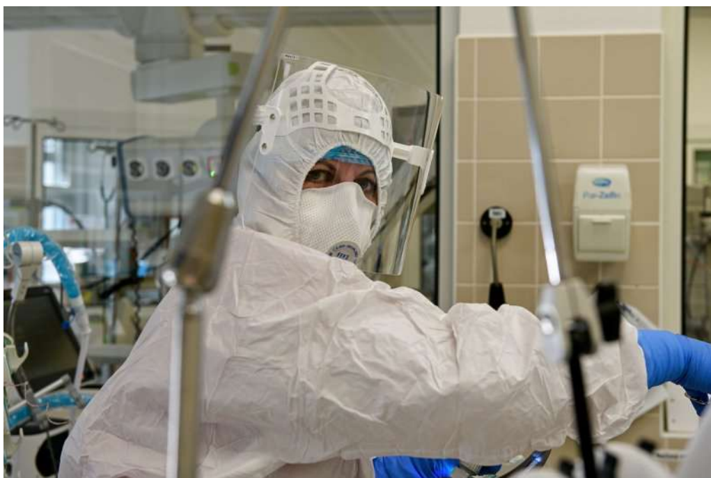
Fotografie: Zdravotnice FN Brno