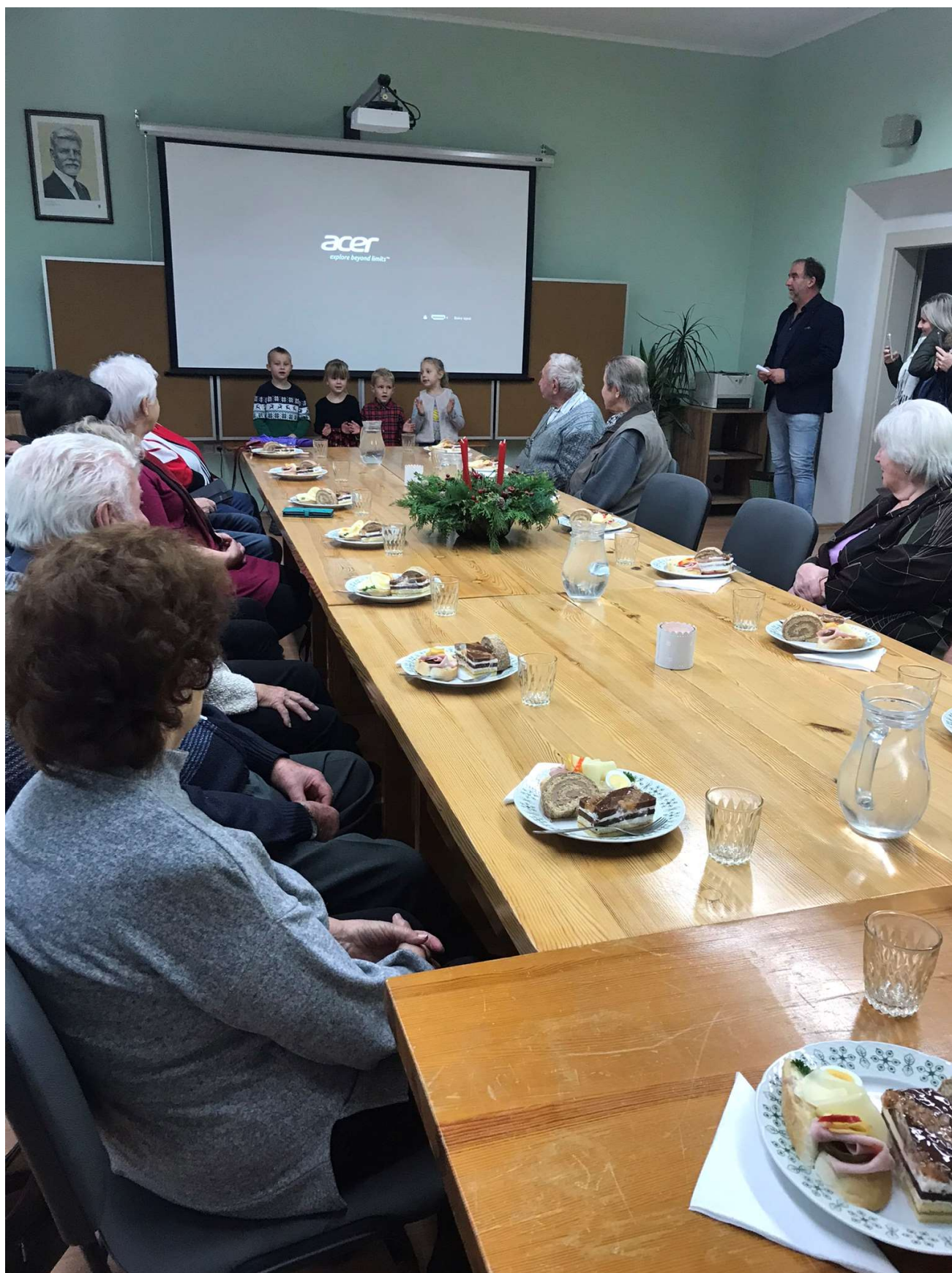
Jubilanti obce při sledování vystoupení dětí z mateřské školy.