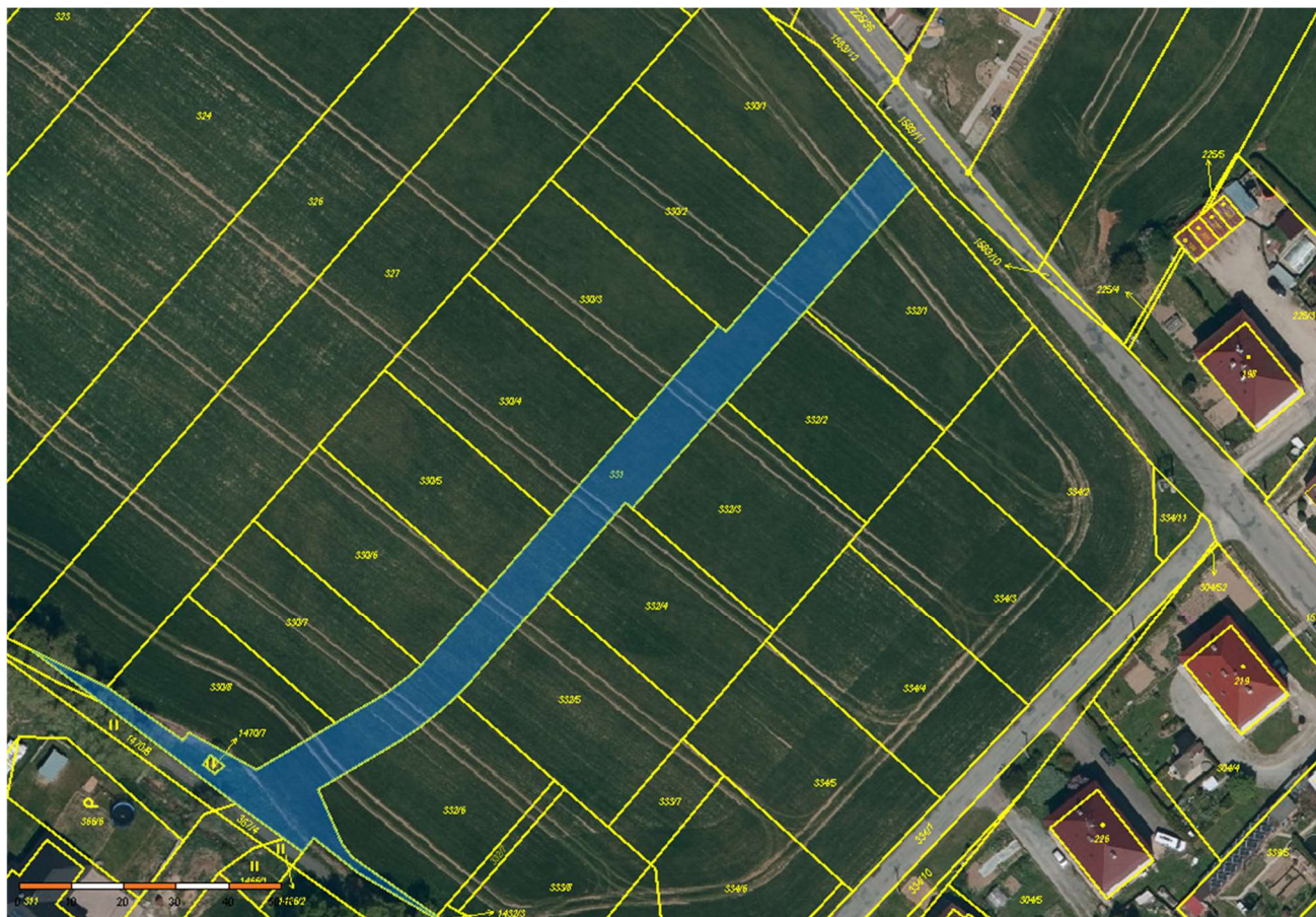
Parcelace území Z2 s vyznačením pozemku pro novou místní komunikaci.

Majetkoprávně byla řešena budoucí výstavba v území označeném Z2, kde byla řešena parcelace území pozemků soukromých vlastníků a umístění stavby místní komunikace.