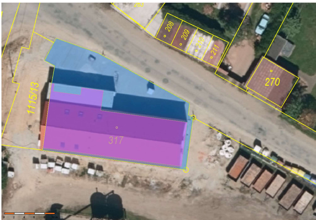
Snímek z katastrální mapy – ortofoto z roku 2024 při realizaci stavby víceúčelové budovy.

V roce 2024 byly užívány pouze prostory garáží. O nájmu části komerčních prostor bylo jednáno s provozovatelem prodejny smíšeného zboží v obci – COOP družstvo HB, se sídlem v Praze, korespondenční adresa Moravské Budějovice.