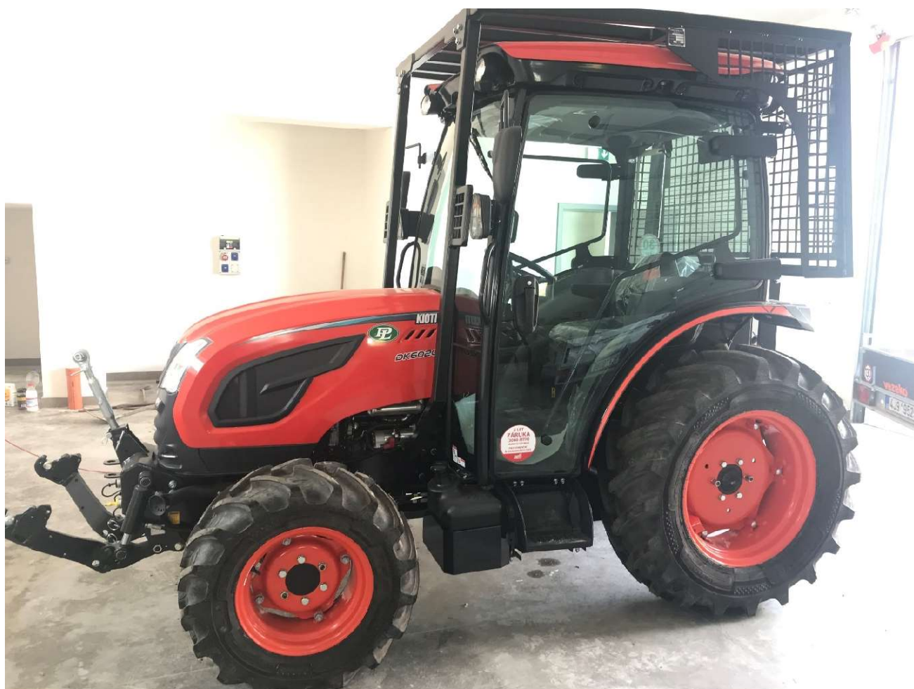
Traktor KIOTI – fotografie v garáži víceúčelové budovy č.p. 158 po převzetí.

Dodavatelem malotraktoru byla firma START Zelený s.r.o., Brtnice, který bude zajišťovat záruční i pozáruční servis.