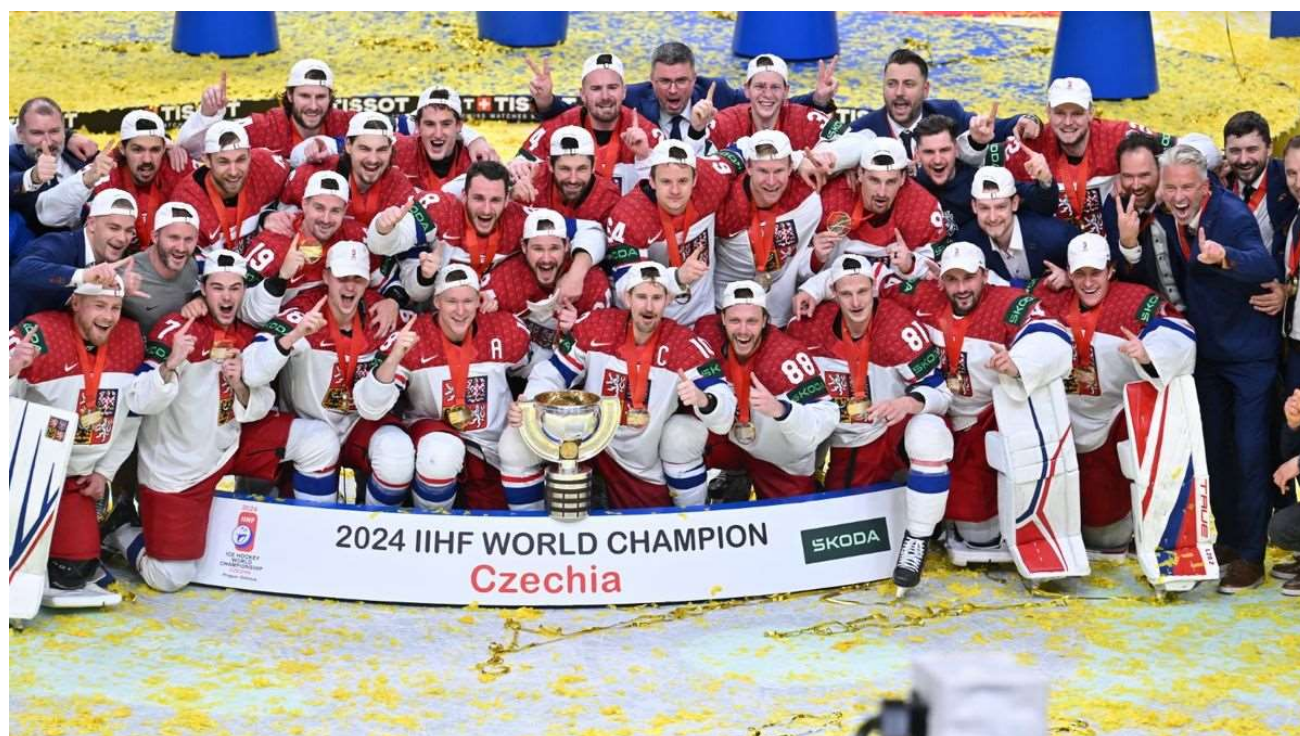
Oficiální fotka národního hokejového týmu na ploše O2 Arény v Praze po finálovém utkání dne 26.05.2024.

Uvedený šampionát vyhrála reprezentace Česka, medaili tým vybojoval po deseti letech, na zlato hráči i fanoušci čekali od roku 2010 (mistrovství světa konané v Německu).