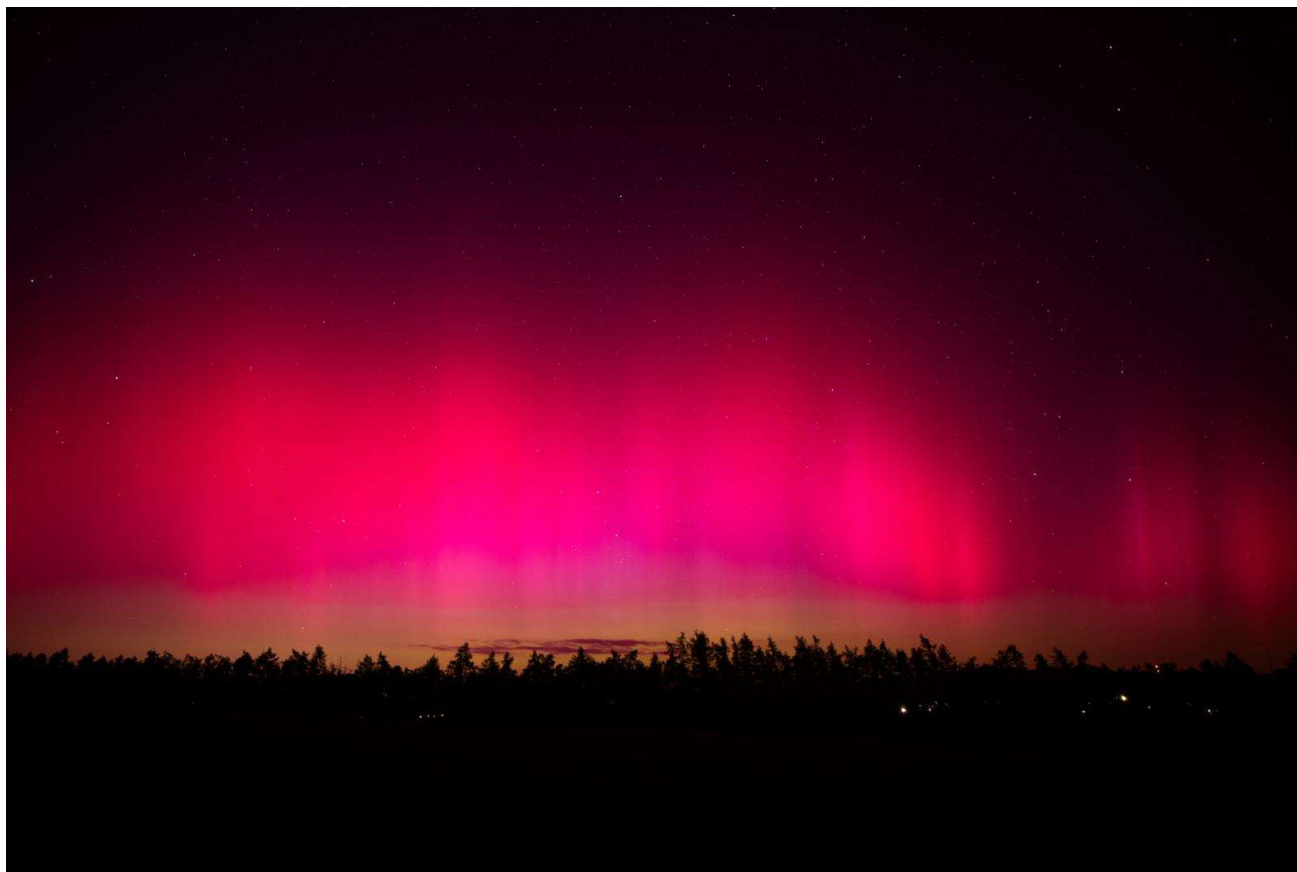
Fotografie polární záře ze dne 10. května 2024. Lesní porost v dolní části fotografie je tzv. „Stráž“. Pohled směrem k obci Nová Ves.

Nejběžnější barva polární záře je zelená, následuje růžová, směs zelené a červené, čistě červená, pak žlutá, nakonec čistě modrá.