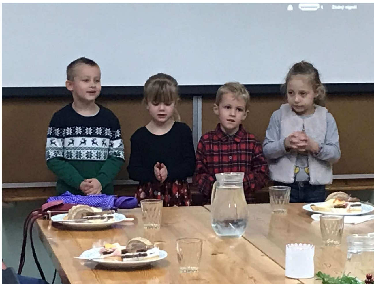
Vystoupení dětí z mateřské školy pro jubilanty obce.